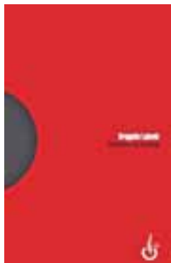
Dragutin Lalović »Države na kušnji« Disput / Nacionalna zajednica Crnogoraca Hrvatske, Zagreb

Autor preispituje shvaćanja da je doba država i državnosti na izmaku, da nastupa postmoderni doba post-države, doba globalizacije i kozmopolitizma. Knjiga studija uglednoga politologa Dragutina Lalovića teorijski obrazlaže i analitički konkretizira politologijsko poimanje države i nastoji pokazati da su to još uvijek prvorazredan teorijski problem. Bez strogog određenja pojma države ne može biti valjanih komparativnih istraživanja tranzicijskih procesa u tzv. postkomunističkim zemljama.