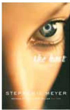
Stephenie Meyer »The Host«

Nekadašnja kućanica Stephenie Meyer planetarno je postala poznata čim je objavila svoj prvi roman »Sumrak« 2003. godine. Njena se serija romana o vampirima među tinejdžerima prodaje u milijunima primjeraka i mjesecima drži prva mjesta na top listama. Obožavatelji čak slave i njen dan 13. rujna, datum kada je »rođena« junakinja Bella koja se provlači kroz romane o napetom suživotu vampira i ljudi.